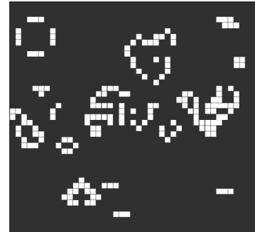
Figura 1: Wynik działania gry w życie (Golly).

Napisz (nie kopiuj) swój własny program do gry w życie używając dowolnej technologii. Inspiracje: https://rosettacode.org/wiki/Conway's_Game_of_Life